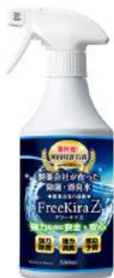
フリーキラZ スプレータイプ500ml