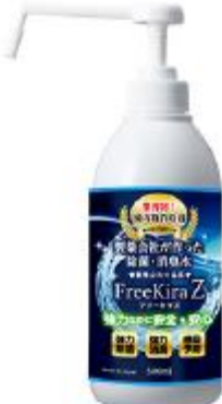
フリーキラZ ポンプタイプ500ml