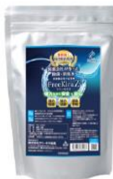
フリーキラZ 1,000mL詰替用